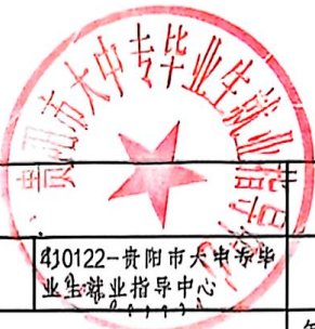
2025年项目支出绩效目标批复表